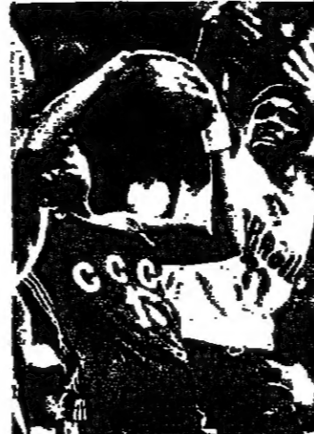
لطفة من مباراة البرازيل والاتحاد السوفياتي لكرة السلة